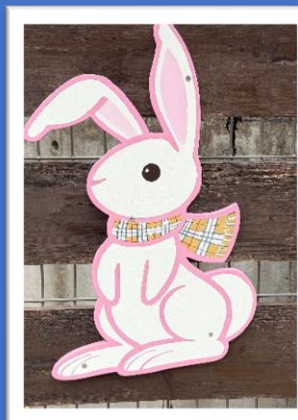
きれいに塗り替え、裏庭が明るくなりました。