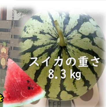
スイカの重さ 8.3 kg