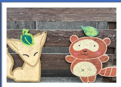
雨風で汚れてしまった動物たち