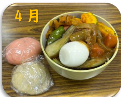
かれー・紅白まんじゅう