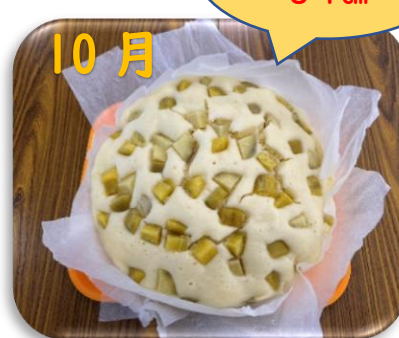
あんだんて農園にて収穫した サツマイモで蒸しパンづくり