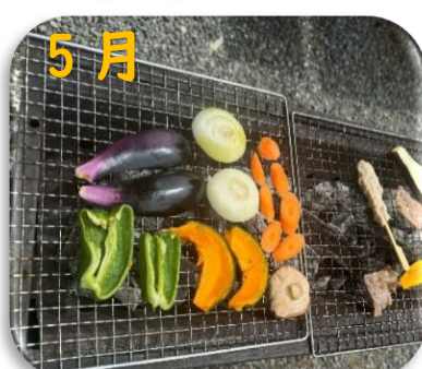
裏庭にて BBQ — 10 —